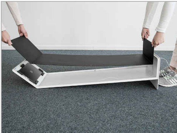
Abb. 5: Rückseite anschrauben

Legen Sie das am Tablet eingesteckte Ladekabel nun im Gehäuse entlang der Schraubengewinde bis zum Fuß des Tabletständers. Führen Sie das Kabel durch das vorgesehene Loch im Standfuß, so dass der USB Stecker unter dem Fuß zu sehen ist.