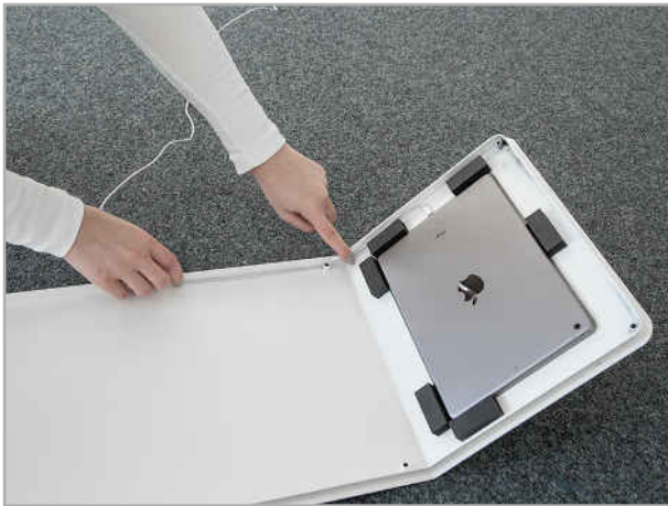
Abb. 4: Kabelführung im Gehäuse