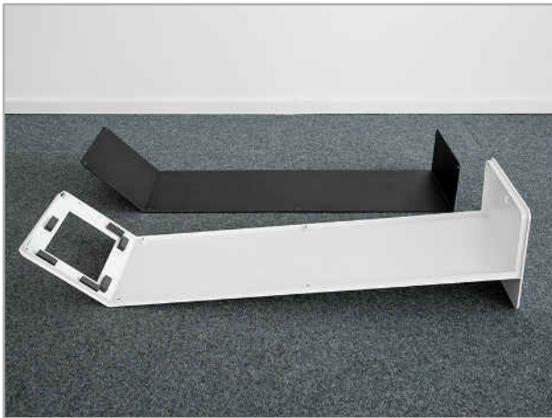
Abb. 2: Rückseite entfernen

Nehmen Sie den im Lieferumfang enthaltenen Sicherheits-Imbusschlüssel, lösen Sie die Schrauben auf der Rückseite und bewahren diese für das Anschrauben (Schritt 1.5) der Rückseite auf.