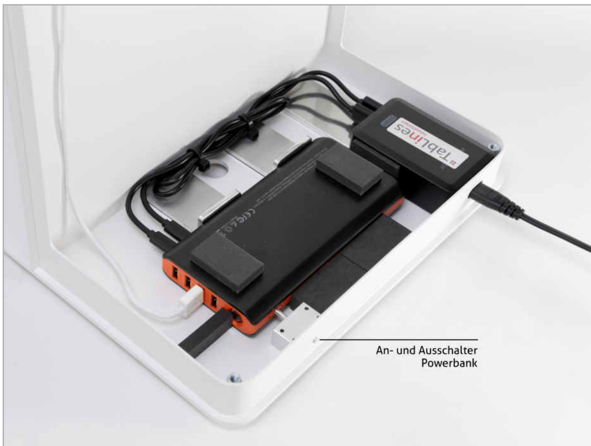
An- und Ausschalter Powerbank