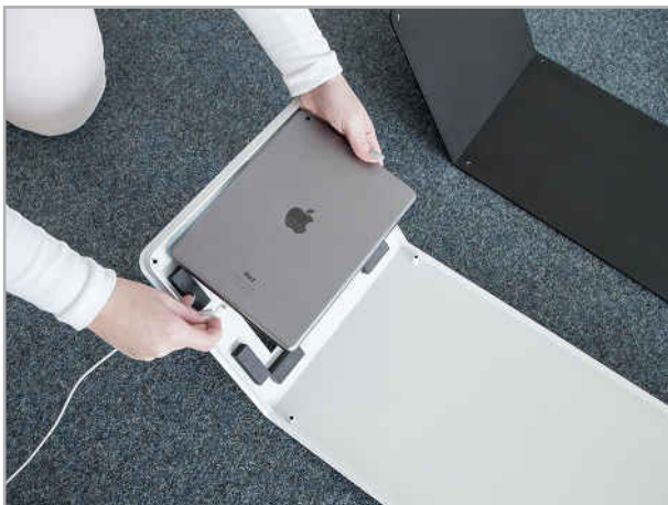
Abb. 3: Tablet einlegen und mit Kabel verbinden

Entfernen Sie die Rückseite des Tablet Bodenständlers mit Hilfe einer zweiten Person und legen diese sicher daneben.