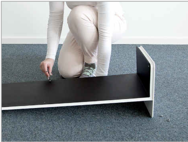
Abb.1 : Schrauben lösen